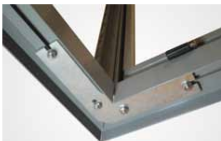
Starka profiler med kraftigt förstärkta hörn och vägganslutningar.