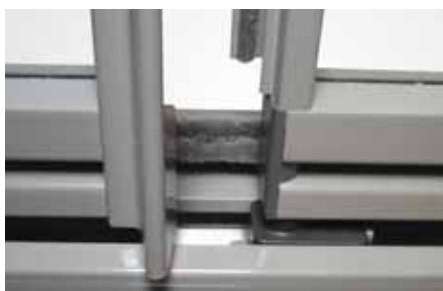
Med vår unika smalramsprofil erhåller du både funktion och design.