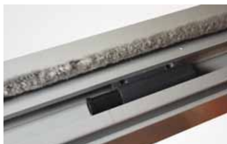
Smart fjädrande funktion i luckorna - en barnsäkerhet.